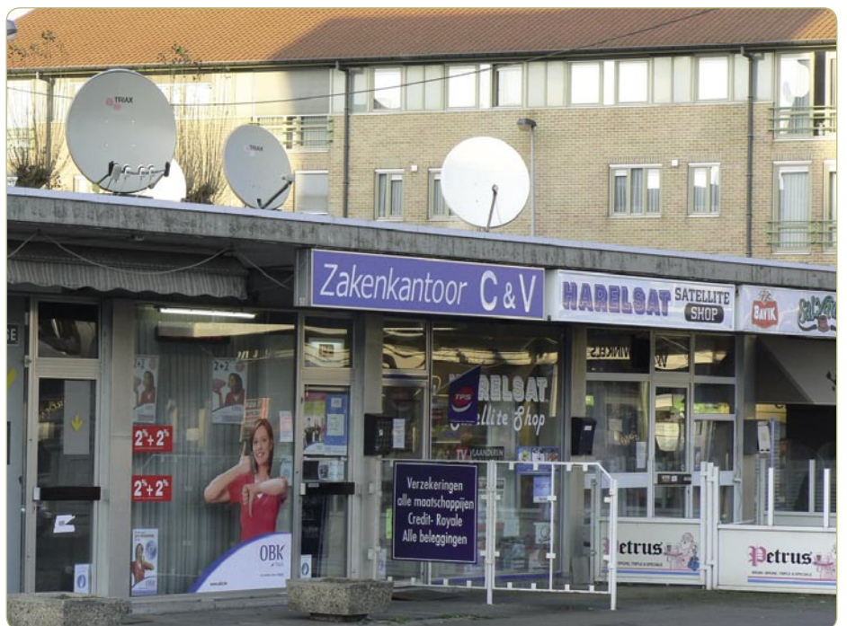
Salı - Cumartesi günleri saat 9-19 arası uydu setlerinin satın alınabildiği küçük Harelsat dükkanı.

gerçekleştirmiştir. 2006 yılında yapılan son fuara 500'ü aşkın ziyaretçi ve 10 katılımcı gelmişti, bunların arasında uydu ve kablo yayın kuruluşları vardı. 2007 yılında ise, Mayıs ayında 20 katılımcı için yer öngören bir sergi planlanmıştır. BSH kulübü, Belçika'nın küçük de olsa oldukça aktif bir uydu piyasası olduğunu gösterir.