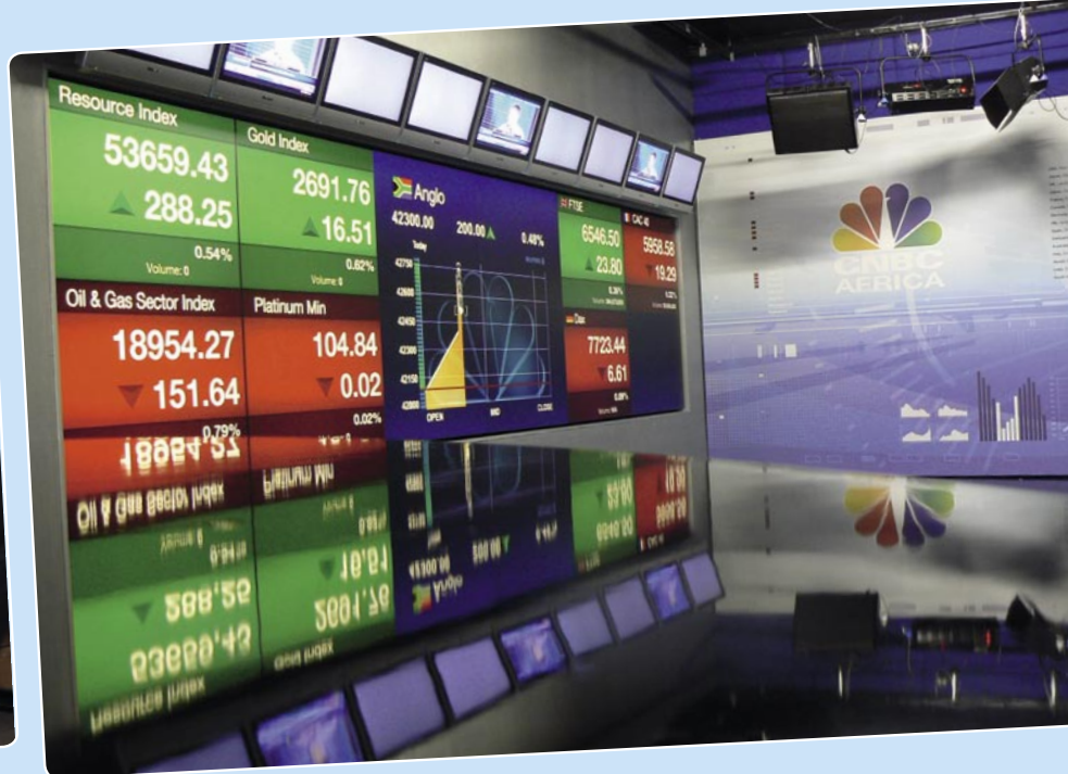
CNBC Afrika Stüdyosundan bir görünüm