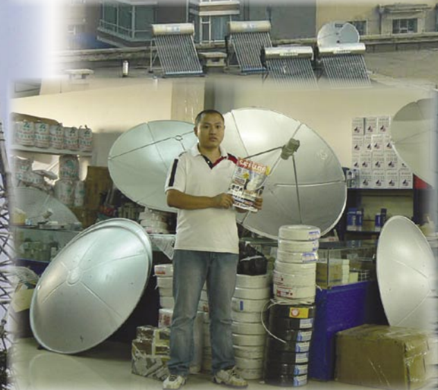
▲ DeLong firmasından Yan elindeki TELE-satellite dergisini gösterirken ".1.2 metrelik antenlerden ayda 500 ve 1.5 metrelik antenlerden 300 kadar satıyoruz. Ama bazen öyle aylar oluyor ki, bu sayı 1000'e çıkıyor!"