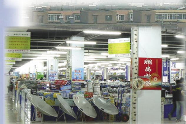
▲ Çin'in doğusundaki bir şehirde bulunan bu elektronik mağazasının dördüncü katında, uydu tutkunları akıllarına gelebilecek her şeyi bulabilir. Yalnızca resmin ön kısmında görünen çanaklar değil, ama aklınıza gelebilecek her türlü Ku ve C-bant LNB, DiSEqC şalterler, uydu alıcıları ve millerce uzunlukta koaksiyel kablo