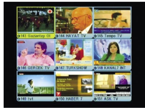
Dokuz görüntü aynı anda |