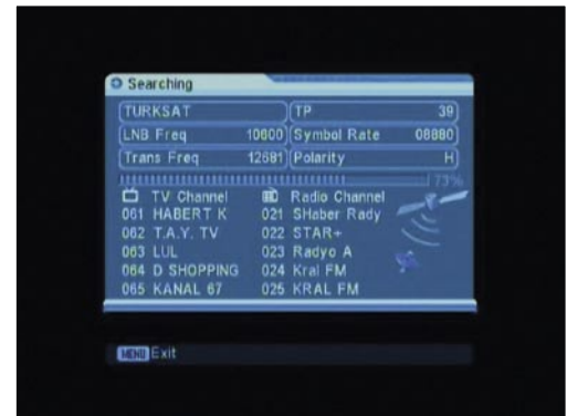
Uydu arama |