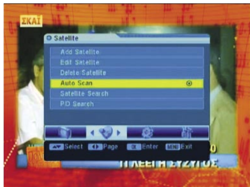
Kurulum Menüsü |