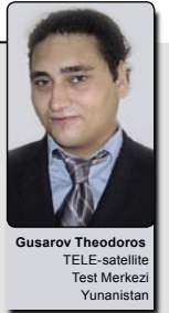
Gusarov Theodoros TELE-satellite Test Merkezi Yunanistan