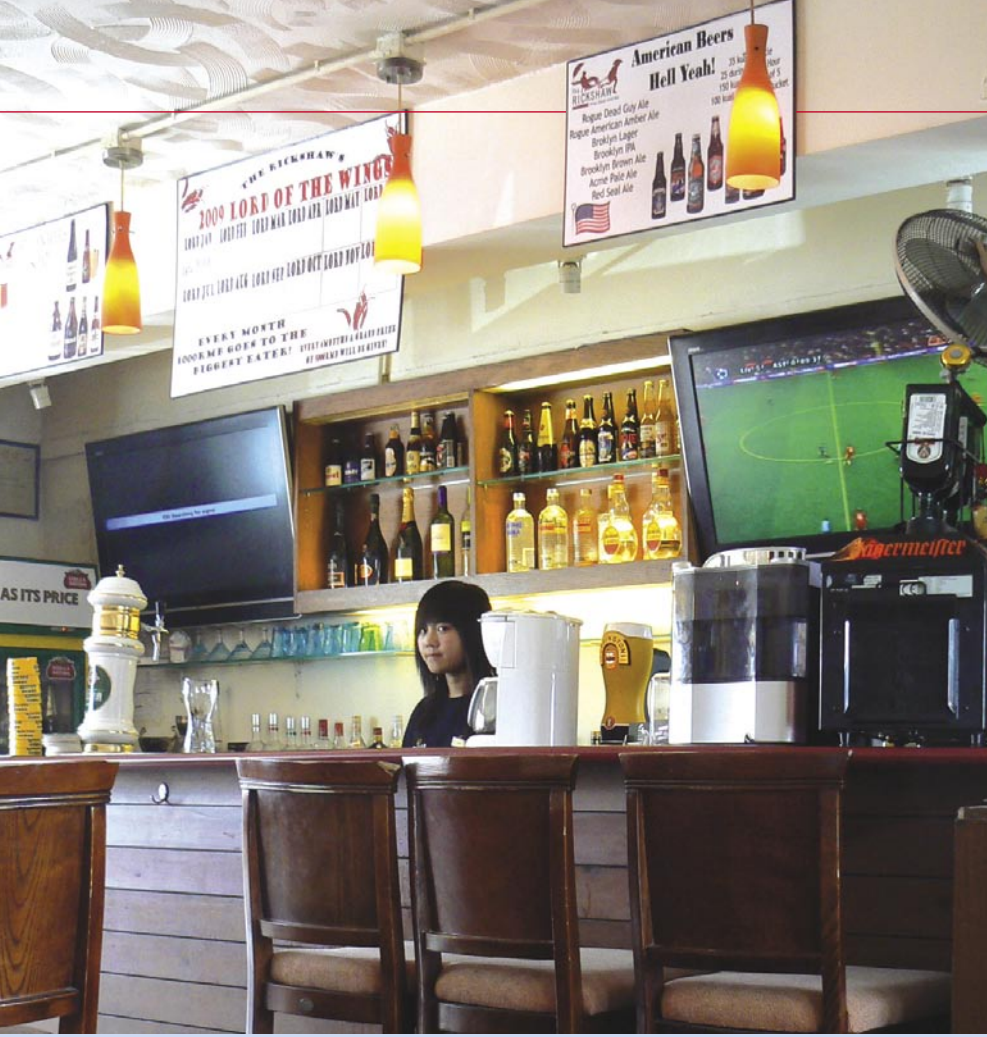
■ Bardaki düz panel TV'lerde sürekli spor yayınları oynuyor.